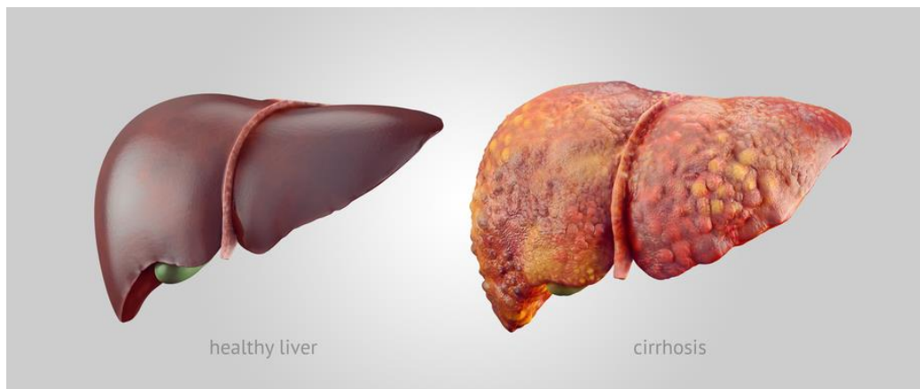
Figuur : een normale lever links, een cirrotische lever rechts.

Chronische aandoeningen van de lever, zoals onder meer chronische hepatitis B en C, overmatig alcoholgebruik, niet-alcoholische steatohepatitis (NASH) of leververvetting leiden tot chronische leverschade, ook wel leverfibrose of leververlittekening genoemd. Indien de oorzaak tijdig wordt aangepakt, is deze leverfibrose omkeerbaar. Blijft de fibrose toenemen, dan ontstaat onomkeerbare leverschade die levercirrose wordt genoemd.